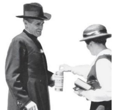
Jesuitenpater Rupert Mayer, Patron der Caritas im Erzbistum, sammelte schon 1935 mit der Caritas-Büchse vor St. Michael in der Münchner Fußgängerzone.

Die Sammlungsgelder unterstützen und ermöglichen soziale Aufgaben vor Ort. 40 Prozent verbleiben in der Pfarrgemeinde, 60 Prozent gehen an die örtliche Caritas, die damit Dienste finanziert, die nicht ausreichend öffentliche Förderung erhalten, und Menschen in Not beisteht.